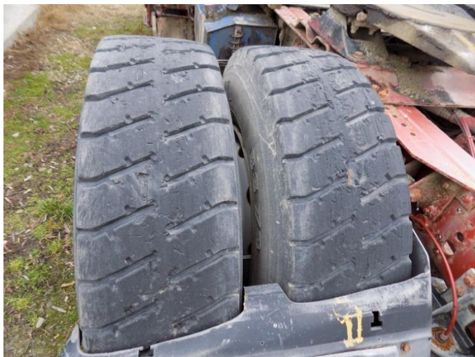
1. Iveco Stralis - stanje guma