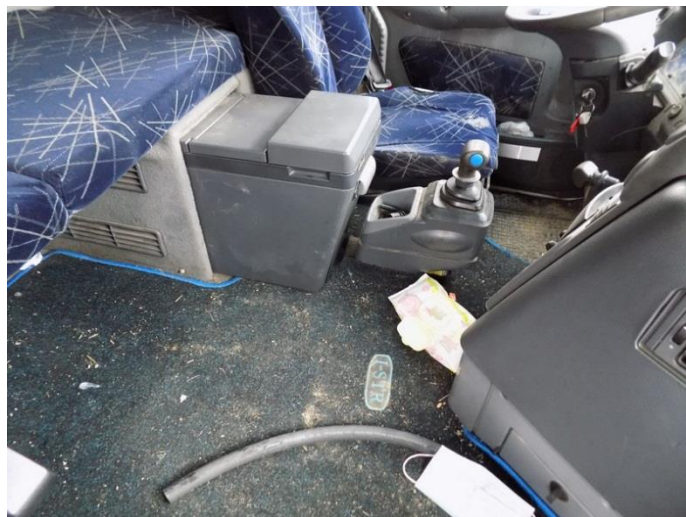
2. Iveco Stralis – unutrašnjost vozila