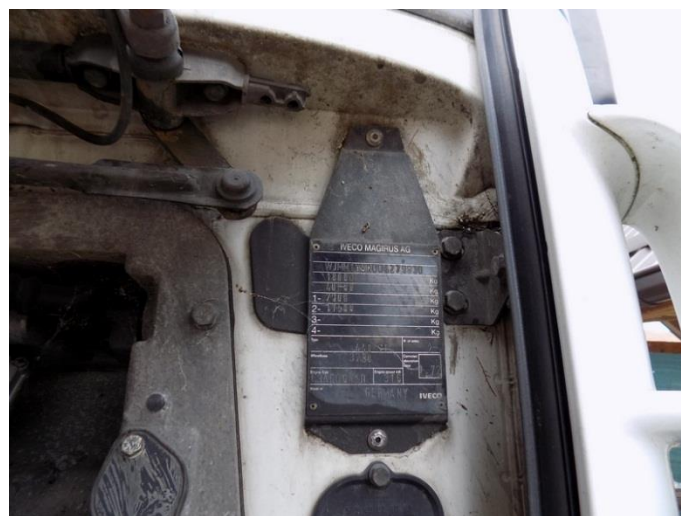
4. Iveco Stralis – broj šasijske