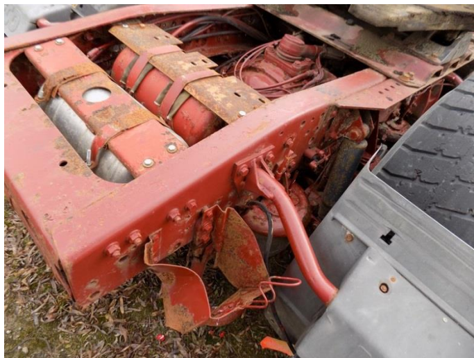
3. Iveco Stralis - karoserija